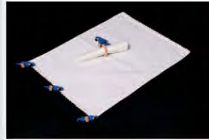
CFSAB.JA.03 ■ PR ■ CR