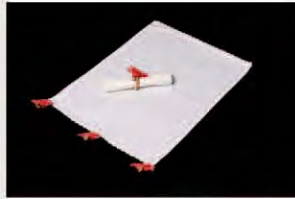
CFSAB.JA.02 ■ PR ■ CR