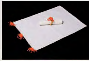
CFSAB.JA.02 ■ PR ■ CR