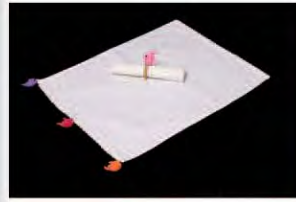
CFSAB.JA.03 ■ PR ■ CR