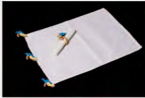
CFSAB.JA.01 ■ PR ■ CR