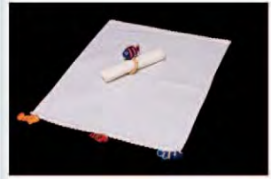
CFSAB.JA.04 ■ PR ■ CR