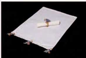
CFSAB.JA.05 ■ PR ■ CR